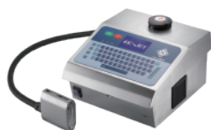
DOD大字符喷码机系列