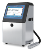
小字符喷码机系列