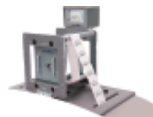
TTO热转印打印机系列