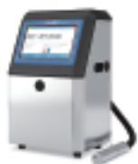
小字符喷码机系列