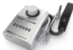
高解析喷码机系列