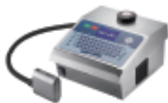
DOD大字符喷码机系列