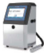
小字符喷码机系列