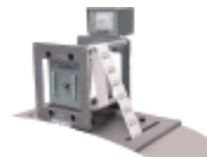
TTO热转印打印机系列